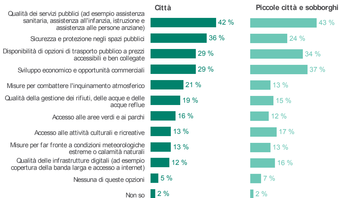
Figura 2 Gli aspetti che richiedono maggiori miglioramenti per gli europei che vivono nelle città, nelle piccole città e nei sobborghi (Eurobarometro 2025).

L'UE considera le città e le altre zone urbane dell'UE partner fondamentali nell'attuazione delle politiche volte a realizzare le priorità dell'Unione per il periodo 2024-2029 7 . A tal fine il quadro strategico integrato dell'UE comprende azioni negli ambiti seguenti: i) competitività, digitalizzazione, innovazione e investimenti; ii) inclusione sociale e uguaglianza; iii) sicurezza, protezione e preparazione; iv) alloggi ed edifici a prezzi accessibili, sostenibili, di qualità adeguata e inclusivi; v) azione per il clima, ambiente ed energia pulita; vi) mobilità; e vii) cooperazione internazionale. Tali politiche sono spesso strettamente interconnesse e tengono conto dell'impegno dell'UE volto a promuovere uno sviluppo urbano sostenibile e inclusivo.