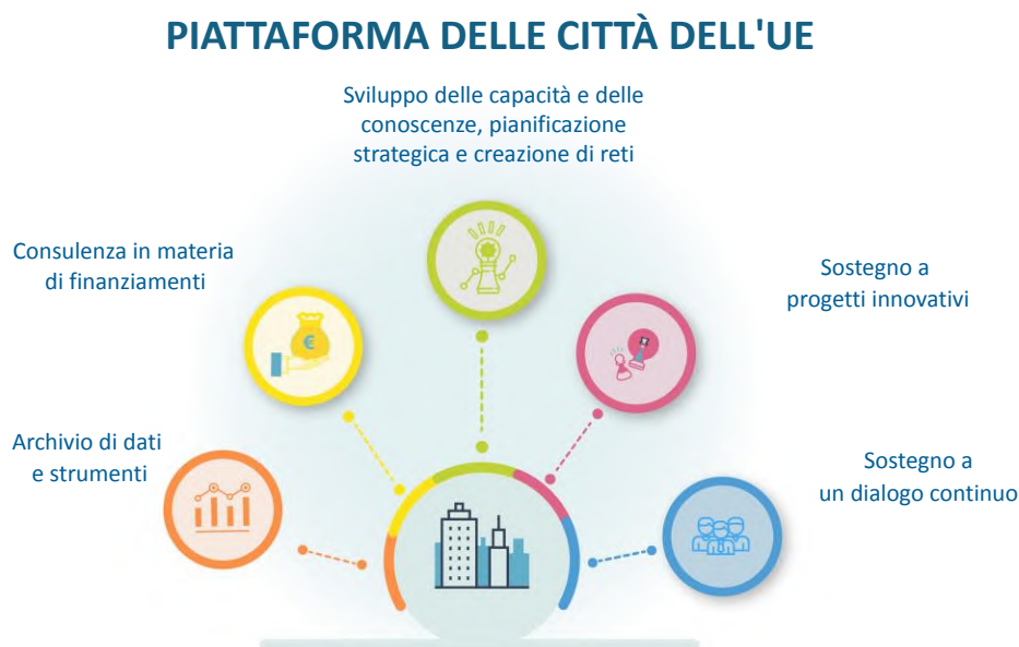
Figura 3. Presentazione visiva della piattaforma delle città dell'UE.

La piattaforma ospiterà e organizzerà i diversi tipi di sostegno forniti dalla Commissione europea alle città in maniera consolidata. Essa costituisce una struttura per l'azione politica e la cooperazione con le città. Sarà composta da diverse iniziative e canali di sostegno, integrati in modo globale, semplificato e accessibile per i beneficiari, garantendo una reale semplificazione e un autentico valore aggiunto dell'UE e agevolando nel contempo la cooperazione in materia di governance multilivello per conseguire uno sviluppo urbano sostenibile e integrato.